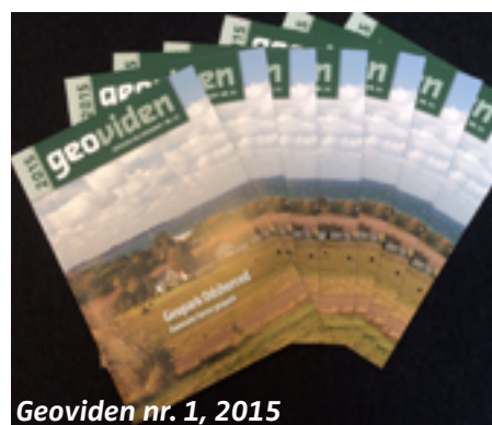
Geoviden nr. 1, 2015

Er du fremover interesseret i at modtage nyhedsbreve fra Geopark Odsherred, skal du blot gå ind på følgende link og tilmelde dig. http://www.geoparkodsherred.dk/odsherred/nyhedsbrev