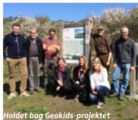
Holdet bag Geokids-projektet