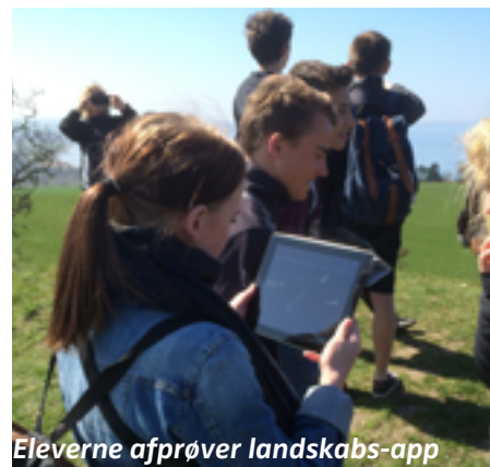
Eleverne afprøver landskabs-app